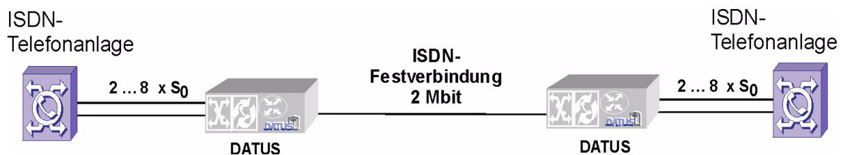
Abb. 2: Anbindung abgesetzter Telefonanlagen über 2 Mbit ISDN-Festverbindungen

Es werden sowohl die öffentlichen (DSS1, QSIG) als auch die privaten ISDN-Protokolle aller wesentlichen Hersteller von ISDN-Telefonanlagen (Siemens Cornet-N und Cornet-NQ, Alcatel ABCF, Tenovis/Avaya TNET, Nortel/Philips/Ericsson DPNSS) unterstützt, so dass die gewohnten Leistungsmerkmale der Business-Telefonie weiter genutzt werden können.